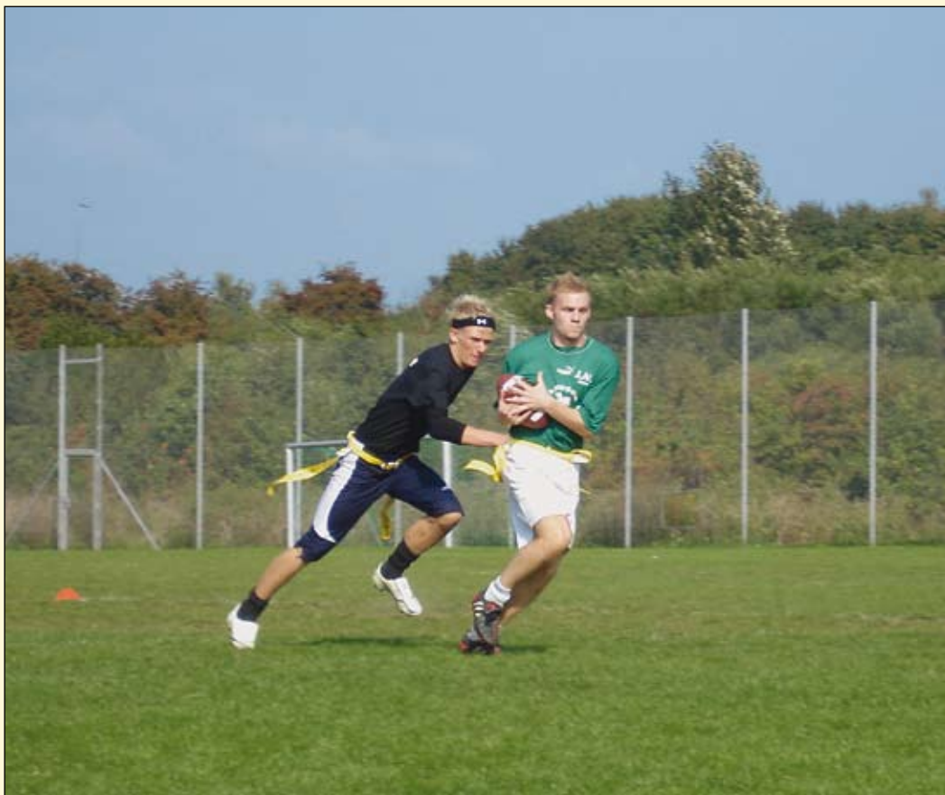
Flagfootball - ny sportsgren under HOG fodbold i 2007.