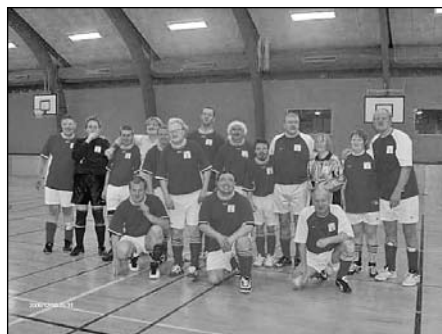
Spillerne fra Hadsten-Hinnerup Handicap IF.