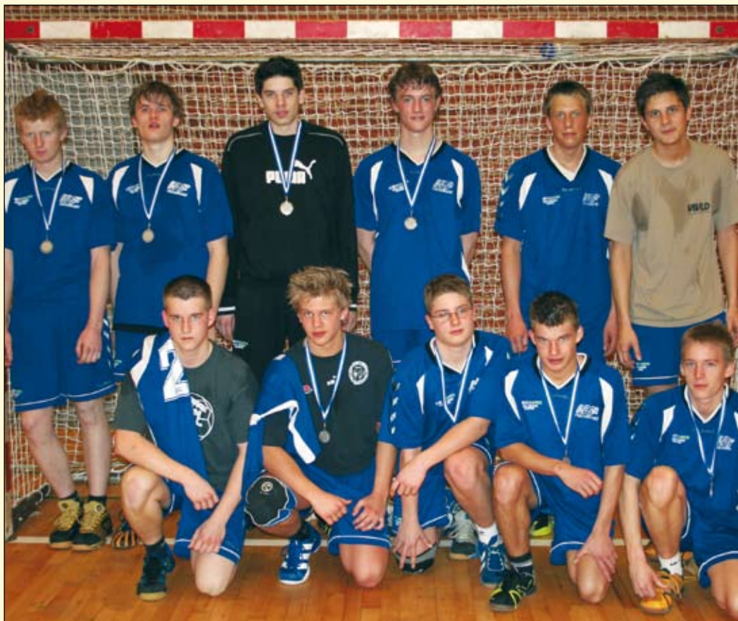
HGF/HOG herreynglinge sølvvindere ved KredsCup, der afholdtes i Mårslet Hallen den 3. marts.