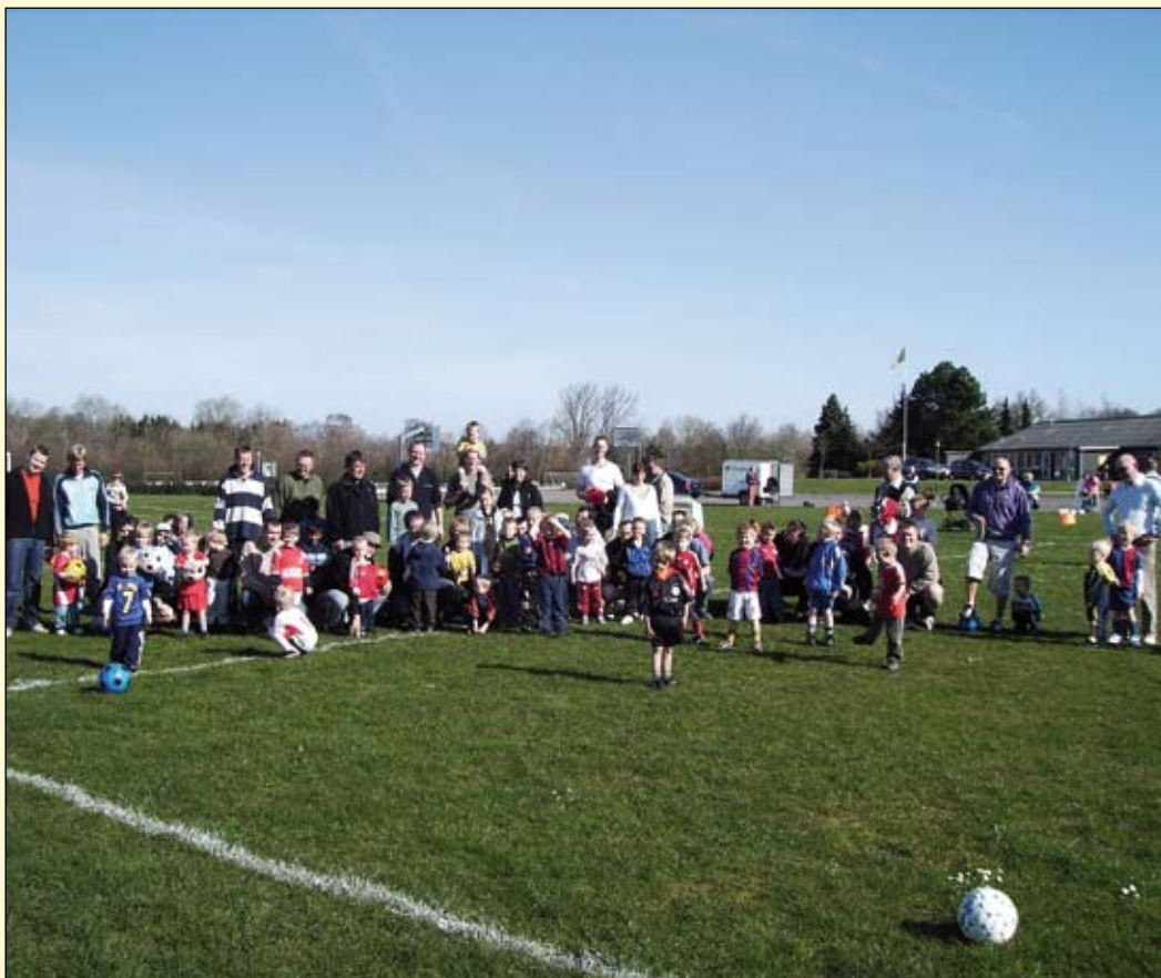
Mikrofodbold for drenge og piger i alderen 3-5 år hver lørdag kl. 10-11 ved Rønbækhallen.