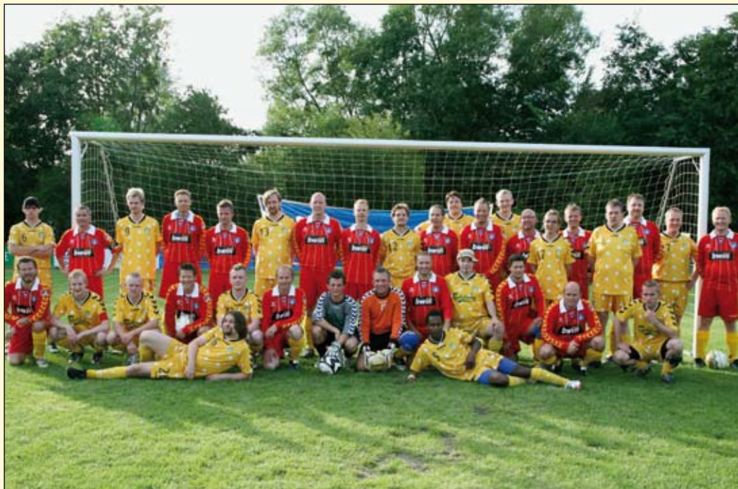
MFC Zulu og OB 30 M2 ved Hinnerup Cup 2007.