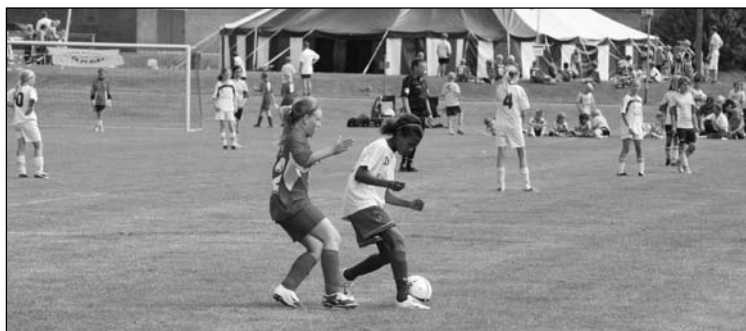
Pigekamp ved Hinnerup Cup 2007.