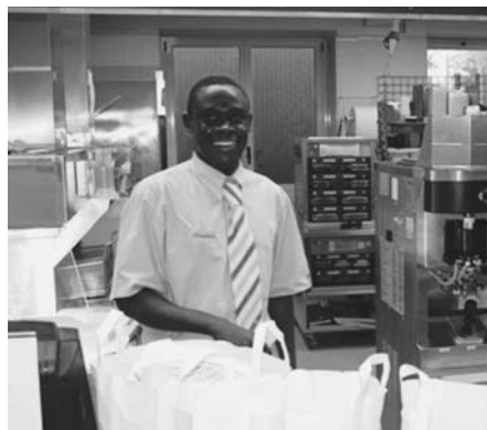
En bestilling på 128 burgere (kun til den ene bus gav god omsætning og smil).

Vi tager af sted fra Rimini fredag kl. 9 og forventer at være i Hinnerup kl. 9 eller 10 lørdag formiddag. Vi spiser aftensmad syd for München, og herefter går natten gennem Tyskland. Morgenmad og herefter køb af slik for de sidste Euro ved grænsen, inden vi ankommer til Hinnerup.