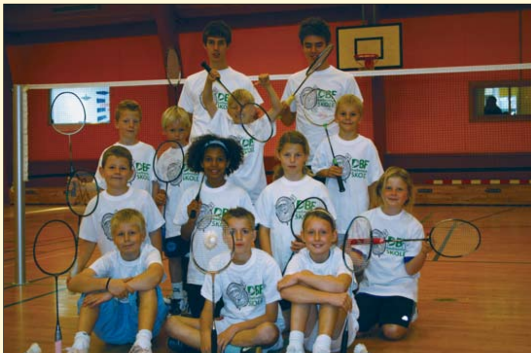
Badmintonskole - efterårsferien 2007.