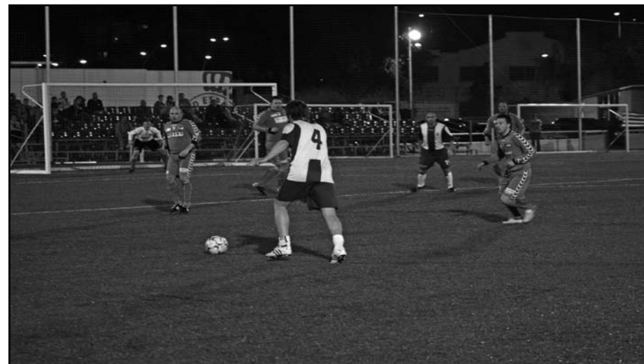
RCD Espanyols veteraner og HOGs Oldboys 30+ i kamp.

Besøg også holdets hjemmeside www.hog-oldboys30.dk , hvor du kan læse, hvad pressen skrev, se både TV2 Østjyllands og Spansk TV 3's billeder og sidst men ikke mindst downloade holdets musikvideo.