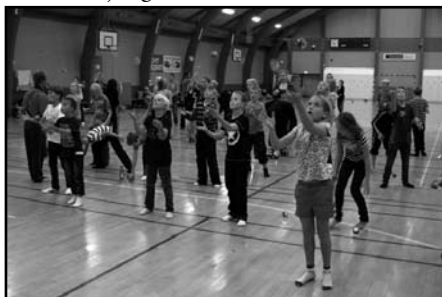
Mange bolde i luften men også på gulvet!

Men nej, vi have fået fat i 2 artister, der optrådte for os i en time, og så var der undervisning i jonglering for alle bagefter. Det var et super godt show, som alle var meget begejstrede for, og de fleste af os fik da lært at jonglere.