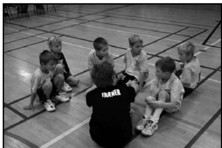
Der lyttes alvorligt til træneren