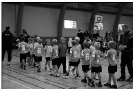
Tak for kampen