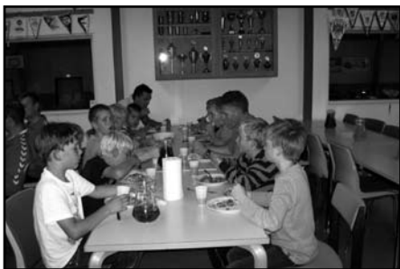
Der bliver spist godt!

Lørdag morgen blev alle hevet ud af deres sødeste søvn af AGF slagsange, som ifølge vores formand er den eneste rigtige måde at blive vækket på. Efter morgenmaden gik dagen med at hygge sig i hallerne mellem de 2 træningspas, som alle holdene fik.