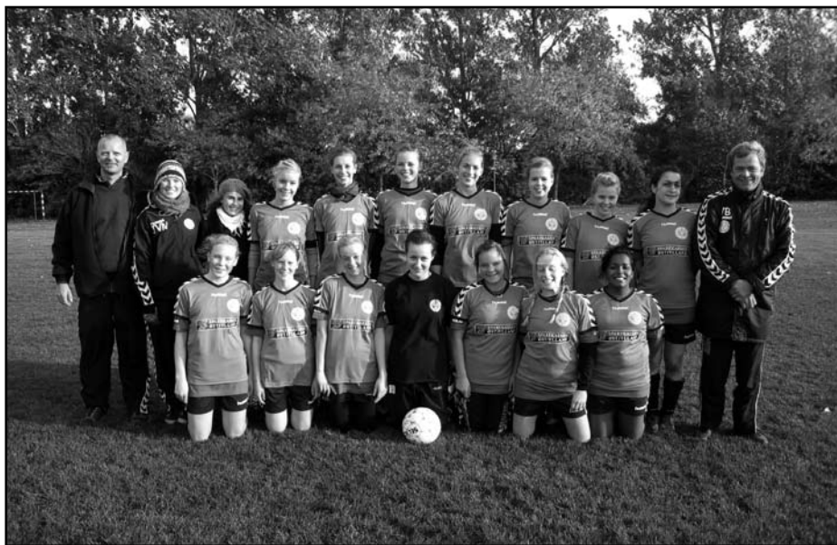
U18 pigejunior 2008.