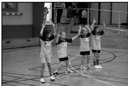
Armene er oppe i forsvaret