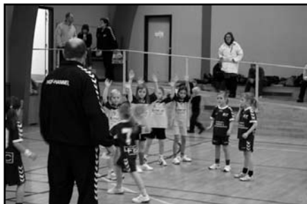
Der bliver dækket flittigt op

HOG Håndbold afholdt sammen med GUI d. 1. november JHF's 75 års jubilæumsstævne i HH-Hallen. I alt 34 hold fra 7 forskellige klubber var i ilden til stævnet, og der var spændende kampe dagen lang fra kl. 9.00 til kl. 15.15.