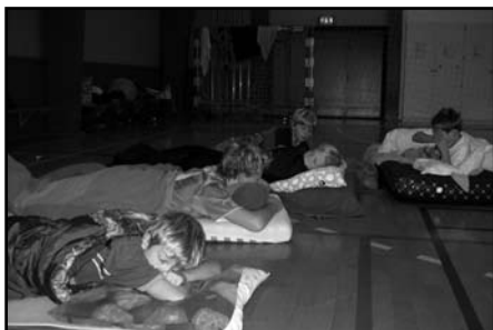
Vækning med AGF musik!

Alle mødte ind fredag aften, og hvert hold fra U10 til U14 fik et træningspas. Efterfulgt af saftevand, kage og hygge.