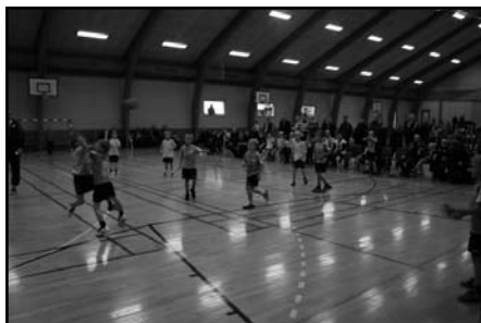
Bolden er i spil