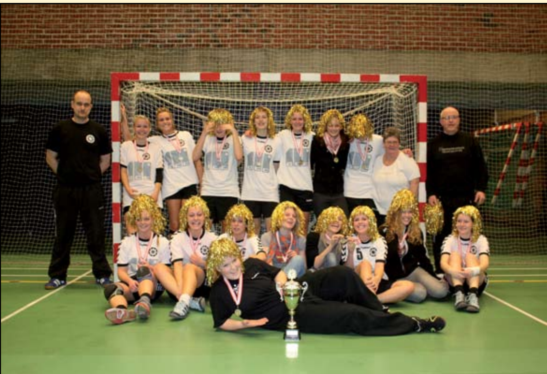
Guld pigerne - Four Stars U16-pigerne vandt overbevisende i Kreds Cup-finalen.