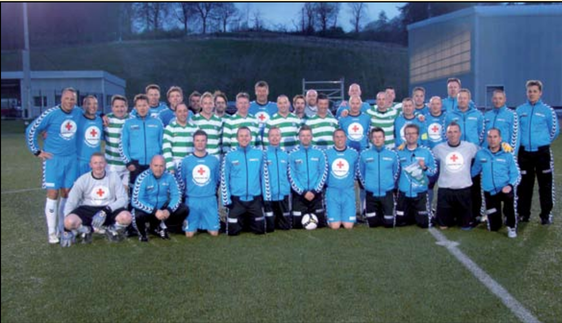
Fodboldeventyr i Skotland - Celtic-spillere sammen med HOG Oldboys 30+ holdet.