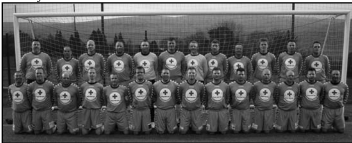
HOG Oldboys 30+ holdet.