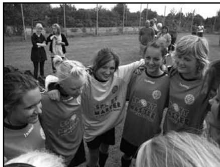
U18 piger i klubsamarbejdet - Four Stars 8382.

Fodboldafdelingen fortsætter også det gode samarbejde med Grundfør GUI omkring U14 drenge og en række af de yngre årgange, hvor der er behov for at samle spillere, så der er trænere og spillere nok til årgangene. Et frugtbart samarbejde, der er medvirkende til at formindske frafald blandt spillerne til stor tilfredshed for klubbernes ledelse, trænere og holdledere.