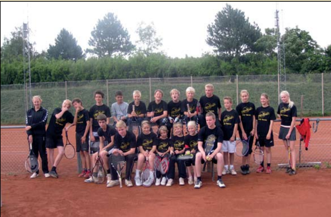
Tennisskole i DGI-regi afviklet i Hinnerup i uge 32.