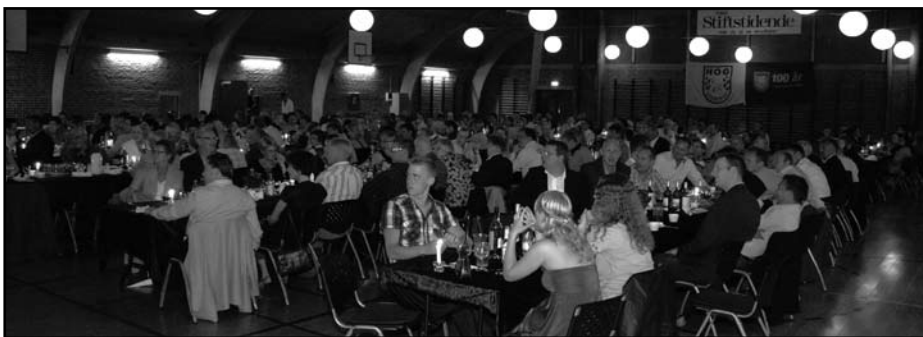
100-års fest med mange deltagere i Rønbekhallen.