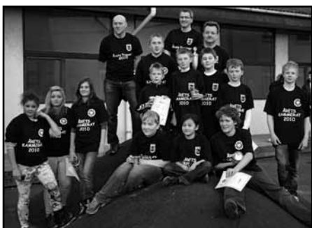
Årets Kammerater, Årets Leder og Årets Træner-team.