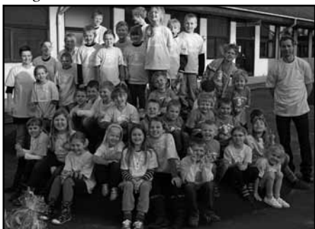
U8 spillere og ledere i deres nye T-shirt.