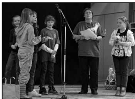
Spillerne på U10 piger siger tak for sæsonen.