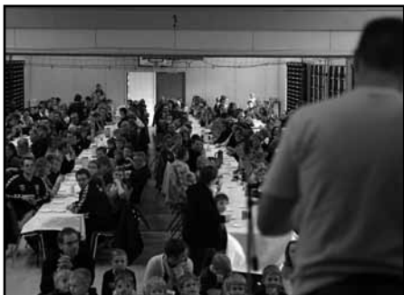
Formanden beretter for en fuld sal om året, der gik.