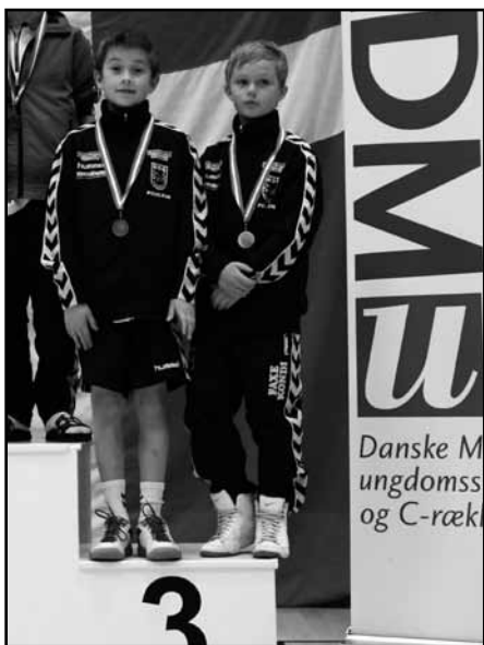
Flot DMU 3. plads.