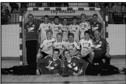
Thy Cup Gruppe 1 finalevindere.

Fantastisk kamp med masser af stemning i hallen, med over 2000 tilskuere.