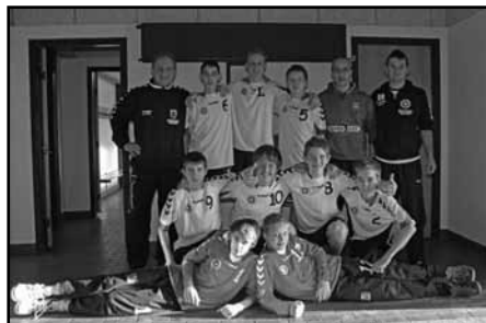
Thy Cup Gruppe 2 finalevindere.

fra allerførste fløjt - at det ville komme til at gøre ondt, men at vi voksne nok skulle slæbe dem fra banen, når sidste fløjt havde lydt. De skulle give alt, hvad de havde. Kampen blev fløjtet op og for at gøre en lang og intensiv historie kort, så kæmpede drengene en fænomenal intens kamp og vandt Gruppe 2 finalen 18-16. Ikke stævnets skønneste kamp, men bestemt en underholdende og spændende kamp, hvor vi følte os som David, der netop havde slået Goliath til jorden. Behøver jeg at sige, at stemningen herefter var helt i top!!!