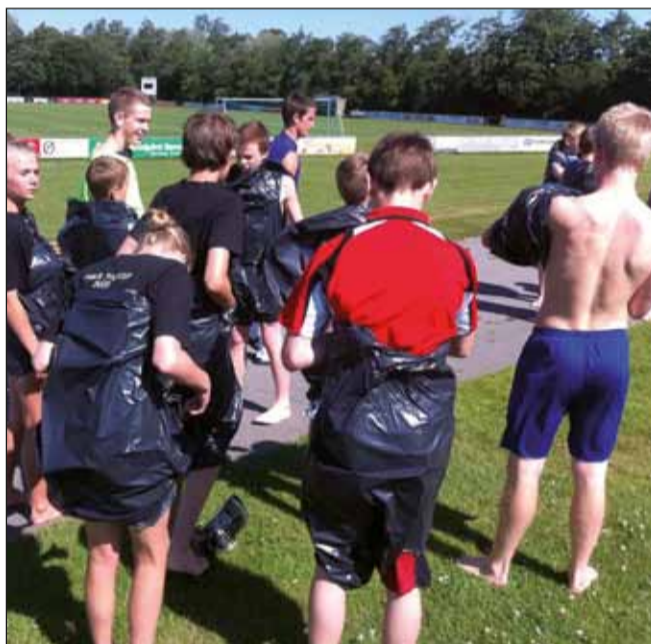
Body bowling på lille lejr