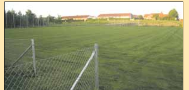
Græsset på de nye fodboldbaner har godt fat.