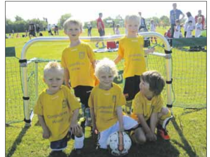
HOG årgang 2006 klar til kamp.

Et herligt syn, at alle drengene hurtigt fandt ud af det sammen. Ligeegyldig om man var stor eller lille, alle var der for at spille fodbold. Holdene fik kæmpet sig gennem 4 kampe hver. Alle var glade og tilfredse ved overrækkelsen af medaljerne. Alt i alt en stor oplevelse for børnene, at spille på "hjemmebane" til sådan et stort stævne! Omkring kl. 1700 fik vi klædt om igen og alle børnene kunne tage hjem fra HH, med en guldmedalje og en god oplevelse rigere. Vi fik pakket trommer og bannere sammen