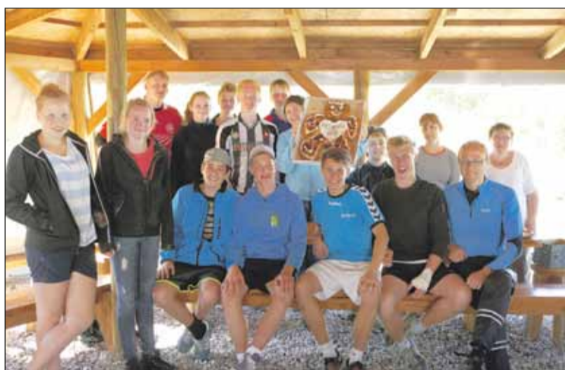
Klar til at fejre dagen med jubilæumskagemand.