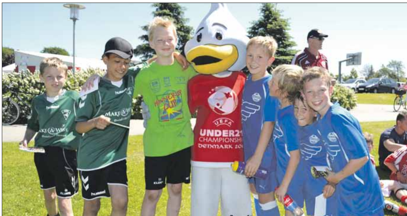
Glade Hinnerup CUP deltagere sammen med U21 Europamesterskabs maskotten - ANDY.