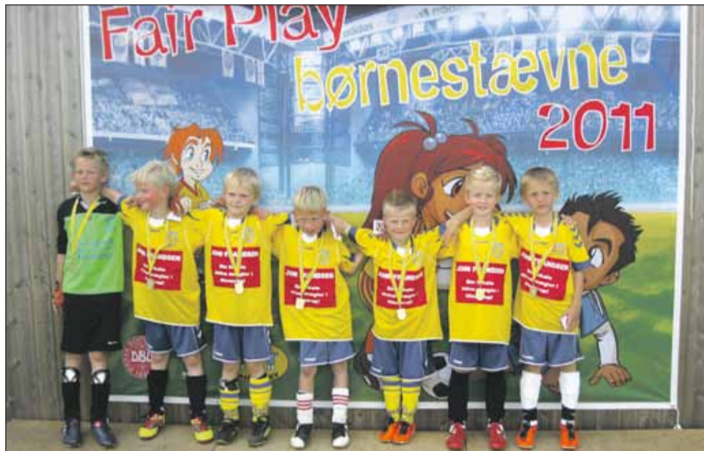
HOG årgang 2003, det ene af de tre hold, der glade og stolte havde modtaget deres medalje.