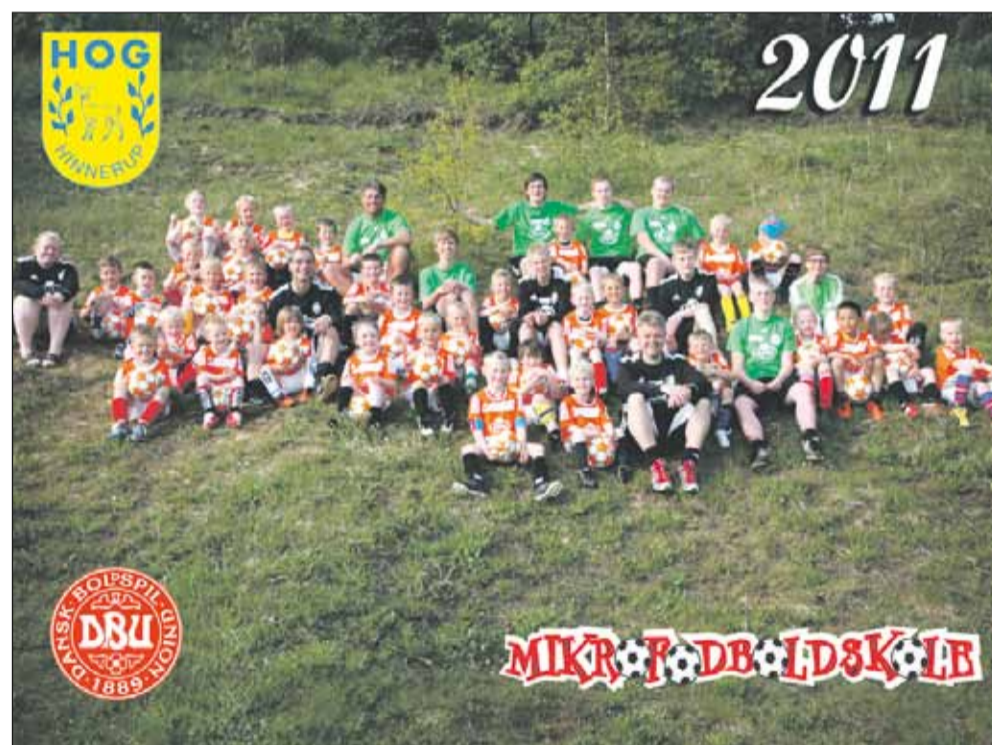
Trænere, forældre og børn samlet ved DBU's Mikrofoldboldskole i Hinnerup.