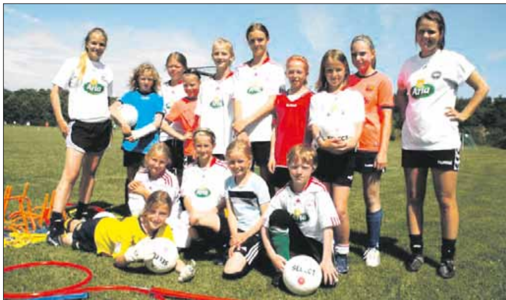
Stor deltagelse af piger ved DBU's fodboldskole i Hinnerup.

HOG fodbold har som tidligere afholdt flere arrangementer indenfor rammen af DBU rettet mod børn og unge. Det har været et fælles kendetegn, at arrangementer har været godt afviklet og der har været særdeles stor interesse for deltagelse.