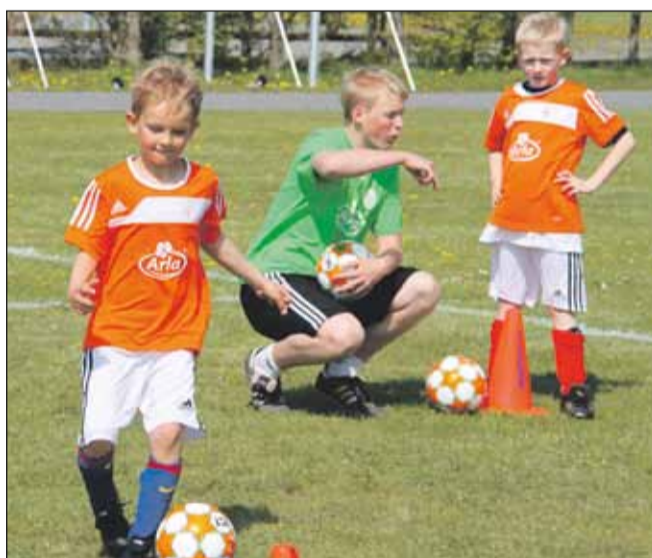
Deltagerne på DBU's fodboldskole får kyndigt instruktion af de mange trænere.