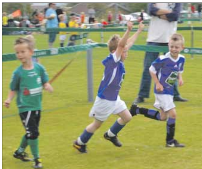
Jubel over scoring ved Hinnerup CUP.

Med deltagelse af 239 fodboldhold kom Hinnerup Cup igen for alvor ind på Danmarkskortet. Deltagerne kom fra store dele af Danmark, og der var endda gode kontakter til hold i Norge og Tyskland, der med fortsat god kontakt forhåbentlig besøger stævnet i 2012. Torsdag var forbeholdt de små spillere der spiller 3x3 og 5x5 fodbold. 139 hold deltog på banerne ved HH og i løbet af dagen var der ikke under 3000 mennesker på fodboldanlægget. Der var biler og glade fodboldspillere, trænere, forældre og bedsteforældre over alt. En fantastisk dag med latter smil om munden. Fredag og lørdag var det 7-mands og 11-mands holdenes tur. Her var der 100