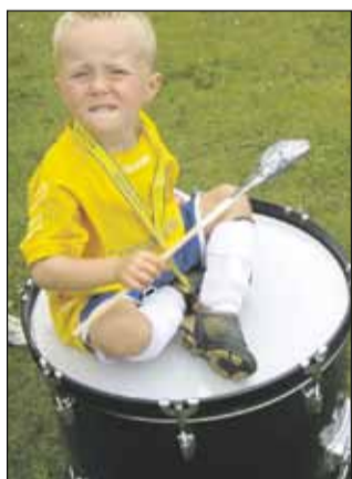
En rigtig HOG-fan klar på trommen...

Forventningens glæde havde længe lyst ud af alle spillere i ugerne op til HOG-CUP. Flere af drengene havde problemer med at sove op til stævnet, de glædede sig simpelthen så meget!! Og ingen gik skuffede derfra!!! Vi startede forberedelserne