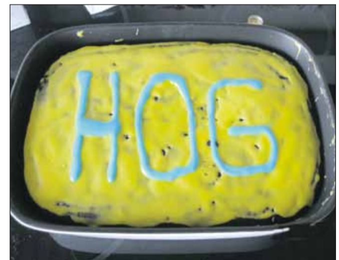
En HOG-kage skulle der til...

Morten Bang Forældre og træner HOG 2003 og 2006