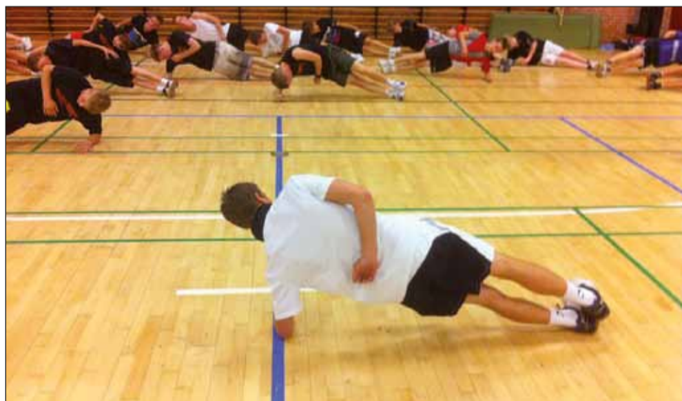
Work out på stor lejr