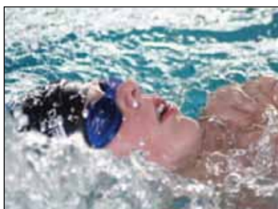
Svømmeafdelingen er klar til den nye svømmeskole.