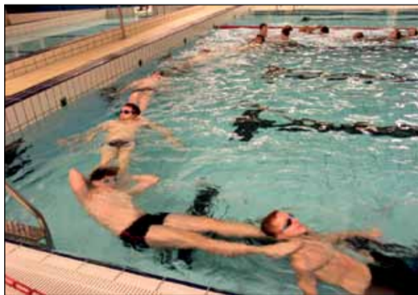
Træner og hjælpetrænere kædesvømmer.

Udvalget planlægger at afholde informationsmøde om vores nye svømmeskole. Dato og sted vil blive annonceret på hjemmesiden og sendt ud på mail.