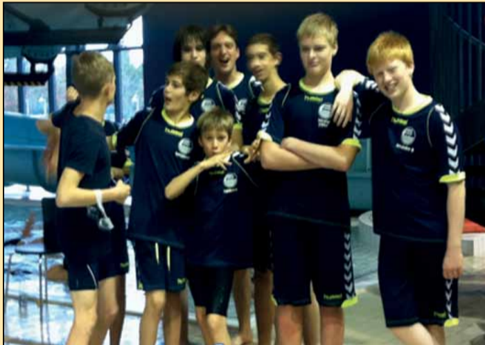
Billedet herover viser talentsvømmerne og træner til Julestævne i Grenå Svømmehal.

Referatet af mødet og Formandens beretning kan læses på svømmnings hjemmeside.