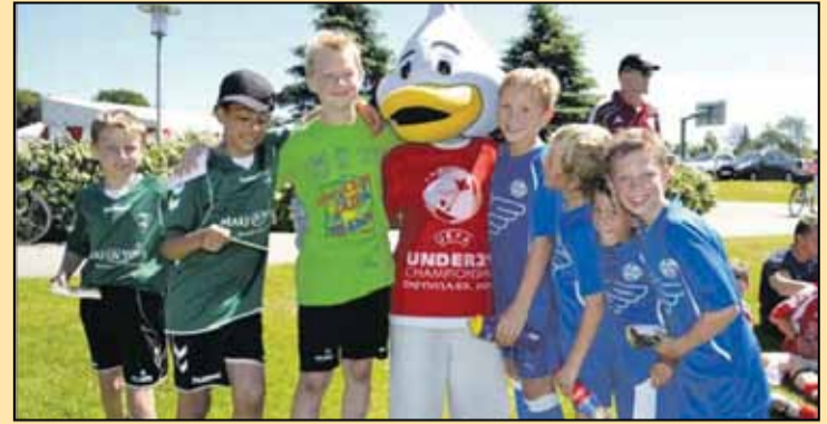
ANDY, den officielle mascot for slutrunden om Europamesterskabet for U21-landshold i Danmark, kiggede forbi Hinnerup Cup 2011. - Også i 2012 har arrangørerne en række sjove overraskelser i ærmet til deltagerne.