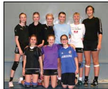
Nogle af Four Stars U14-pigerne; - desværre var en del af pigerne til konfirmationsforberedelse, da fotografen var forbi.

Sportsligt er vi i skrivende stund i en situation, hvor vi grundet vores succes med den sociale integration kan sige, at vi bygger stille og roligt på uge efter uge, og det gælder både hold 1 & hold 2. - (Læs: Vi bliver bedre og bedre uge for uge)