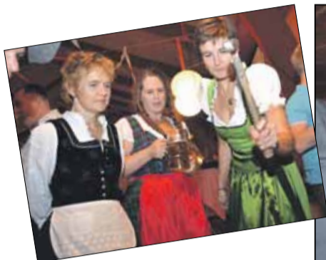
Billederne her på siden viser nogle få glimt fra Oktoberfest-premieren i 2011.